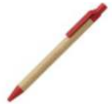
10.174 VITA ECO Papirna hemijska olovka