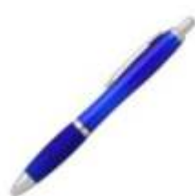
10.103 BALZAC Plastična hemijska olovka