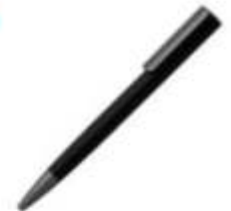
11.080 STELLA Metalna hemijska olovka