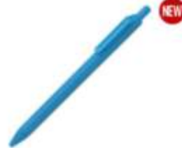
10.197 MARK Plastična gel hemijska olovka