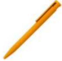
10.170 ZIGI SOFT Plastična hemijska olovka