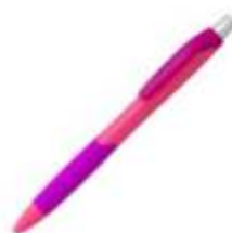
10.087 COLIBRI Plastična hemijska olovka