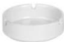
44.019 CINDERELLA Keramička pepeljara 213,00din. Zaliha: 70.449 Prikaz zaliha