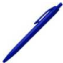
10.161 AMIGA Plastična hemijska olovka