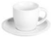
44.060 MOMENTO Šolja za cappuccino sa tacnom od fine keramike, 150 ml 371,00din. Dolazak Prikaz zaliha