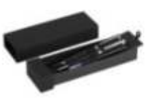
14.140 NEPTUN REGENT metalna hemijska i roller olovka u setu