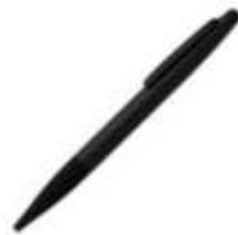
14.137 FENIX Metalna "touch" hemijska olovka sa papirnom navlakom