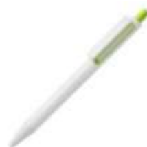
10.194 IVY Plastična hemijska olovka