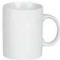
44.047 TEO Šolja od fine keramike, 325 ml 227,00din. Zaliha: 10.154 Prikaz zaliha