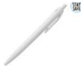
10.177 AMIGA AB Antibakterijska plastična hemijska olovka