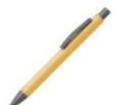
10.184 TITANIUM BAMBOO Drvena hemijska olovka