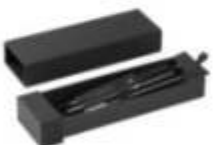
14.146 PANTERA REGENT metalna hemijska i roller olovka u setu