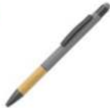
11.081 TITANIUM TOUCH BAMBOO Metalna "touch" hemijska olovka