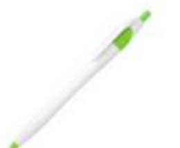
10.083 521 Plastična hemijska olovka