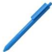
10.178 ONYX Plastična hemijska olovka