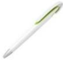
10.097 PALOMA Plastična hemijska olovka