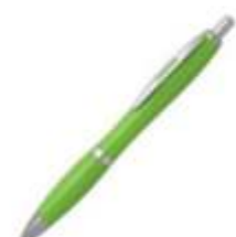
10.163 BALZAC C Plastična hemijska olovka