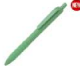
10.200 SYMBOL Plastična hemijska olovka