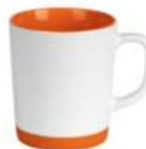
44.111 MINT Keramička šolja sa slikovskim dnom, 300 ml