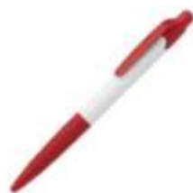
10.190 505 C Plastična hemijska olovka