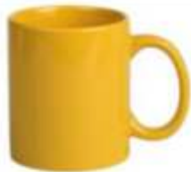
44.058 BARTON Keramička šolja, 325 ml 236.00din. Zaliha: 185.010 Prikaz zaliha