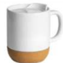
44.125 CORTADO Keramička šolja, 400 ml