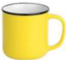
44.080 BETTY Keramička šolja, 250 ml