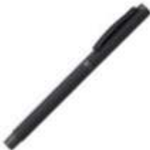
11.074 TITANIUM R Metalna roller olovka