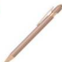
11.082 ARMADA GOLD Metalna "touch" hemijska olovka