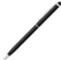
11.059 ALBERGO Metalna "touch" hemijska olovka