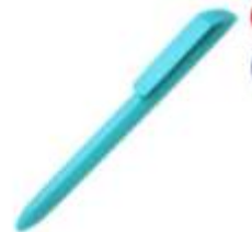
10.195 FLOW PURE Maxima plastična hemijska olovka