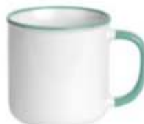
44.081 BETTY BIANCO Keramička šolja, 250 ml