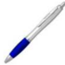
10.164 BALZAC S Plastična hemijska olovka