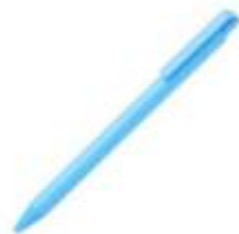
10.192 SCRIPT Plastična hemijska olovka