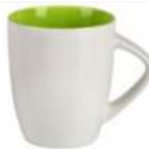
44.055 LILLY Šolja od fine keramike, 300 ml 250,00din. Zaliha: 10.667 Prikaz zaliha