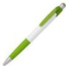
10.039 505 Plastična hemijska olovka