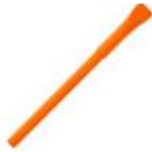
10.109 PAPIRUS Papirna hemijska olovka