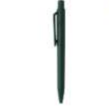
10.162 DOT C Maxima Plastična hemijska olovka