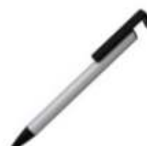
11.060 HALTER METAL Metalna hemijska olovka sa di zalicem za mobilni telefon