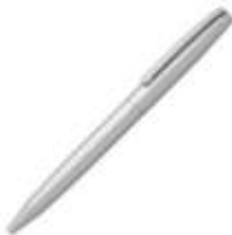
14.141 ZETA Metalna hemijska olovka sa papirnom navlakom