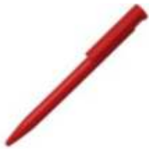
10.169 ZIGI Plastična hemijska olovka