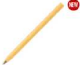
12.012 NINA Drvena hemijska olovka