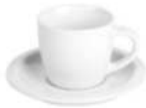
44.059 MOMENTO MINI Šolja za espresso sa tacnom od fine keramike, 100 ml 342,00din. Zaliha: 2.797 Prikaz zaliha