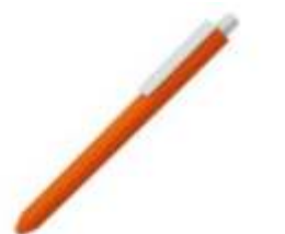
10.157 TERESA SOFT Plastična hemijska olovka