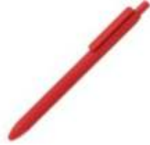
10.191 ZOLA SOFT Plastična hemijska olovka