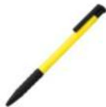
10.182 2001 Plastična hemijska olovka