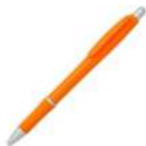
10.033 WINNING 2011 Plastična hemijska olovka