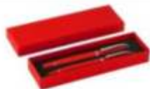
14.161 ASTRA PLUS Metalna hemijska i roller olovka u setu