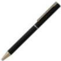
14.142 VEGA Metalna hemijska olovka sa papirnom navlakom