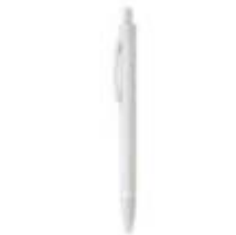
10.167 BRIDGE ECO Hemjska olovka