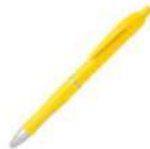
10.091 OSCAR Plastična hemijska olovka