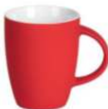
44.119 LUCIA SOFT Keramička šolja, 300 ml