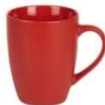
44.114 LAURA Keramička šolja, 300 ml