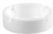
43.010 OPAL PROMO Staklena pepeljara 249.00din. Zaliha: 36.032 Prikaz zaliha