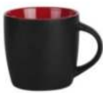
44.062 BLACK BERRY Keramička šolja, 300 ml