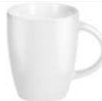
44.048 LUCIA Šolja od fine keramike, 300 ml 250,00din. Zaliha: 25.142 Prikaz zaliha