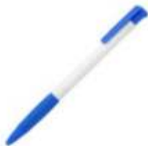
10.189 4001 Plastična hemijska olovka