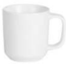
44.044 MOKA Šolja od fine keramike, 275 ml 264.00din. Zaliha: 2.067 Prikaz zaliha