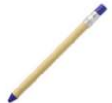
10.193 PARK Papirna hemijska olovka