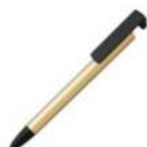
10.136 HALTER Plastična "touch" hemijska olovka sa dršćem za mobilni telefon