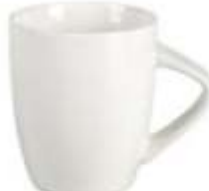
44.063 LILLY BIANCO Šolja od fine keramike, 300 ml