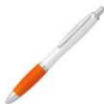
10.104 BALZAC PRO Plastična hemijska olovka