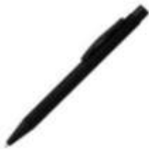
11.076 TITANIUM JET BLACK Metalna hemijska olovka