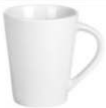
44.108 INVERSO PLUS Šolja od fine keramike, 250 ml