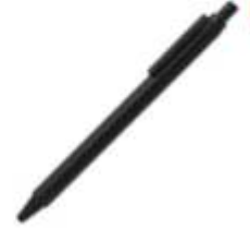
10.198 TINT Plastična gel hemijska olovka