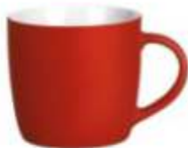
44.103 SOFT BERRY Keramička šolja, 300 ml