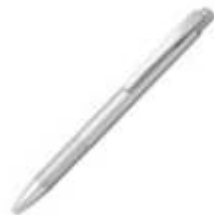
10.106 BART Plastična hemijska olovka