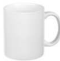
44.025 LASSI Keramička šolja za sublimaciju, 325 ml 213,00din. Zaliha: 75.944 Prikaz zaliha