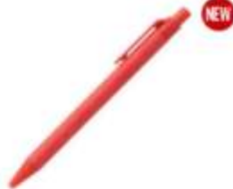
10.196 VITA COLOR Papirna hemijska olovka