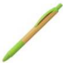
10.188 GRASS Drvena hemijska olovka