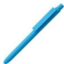
10.180 AVA Plastična hemijska olovka